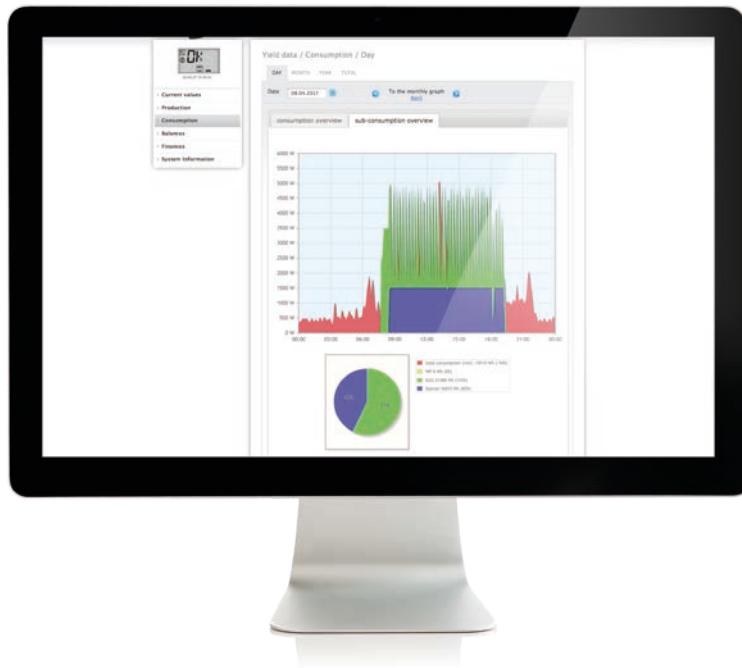
Diagramma di consumo diurno delle utenze collegate

La struttura del menu del Solar-Log permette un controllo intuitivo. Si possono così attivare e prioritizzare utenze intelligenti, come ad esempio AC ELWA-E, in combinazione con Smart Plug e tenendo conto dell'eccesso. Diversi profili di energia e componenti possono essere collegati tra loro e verificati sulla base della simulazione.